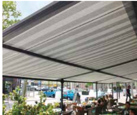
Mittige Leitrohre sorgen ab 350 cm Ausfall für geringeren Tuchdurchhang

Wie beim Q.bus® SZ kann die Novatop Pergola XL-SZ mit seitensaumgeführten Behängen ausgestattet werden.