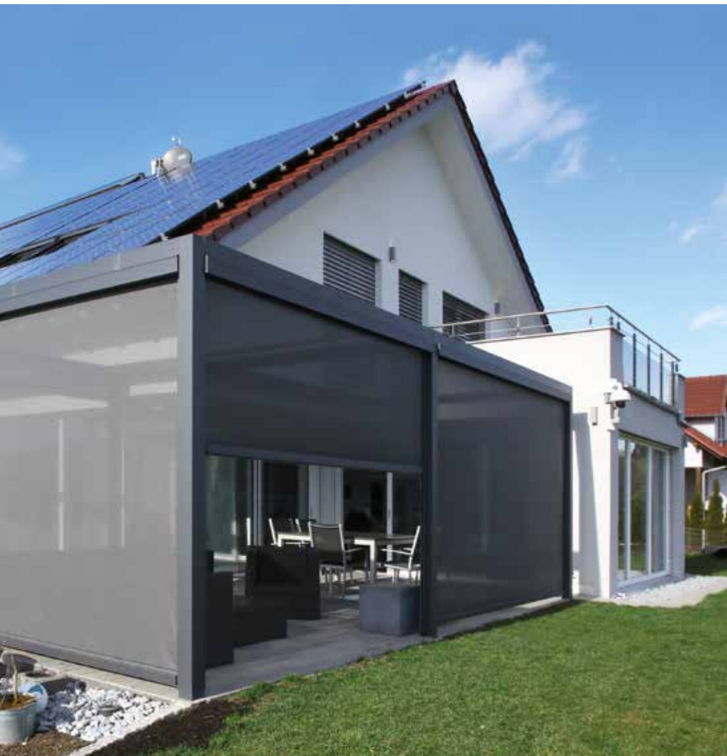
Wohlfühloase: Die Senkrechtmarkise Solaroll SZ mit transparentem Gewebe macht den Q.bus® zum textilem Wintergarten