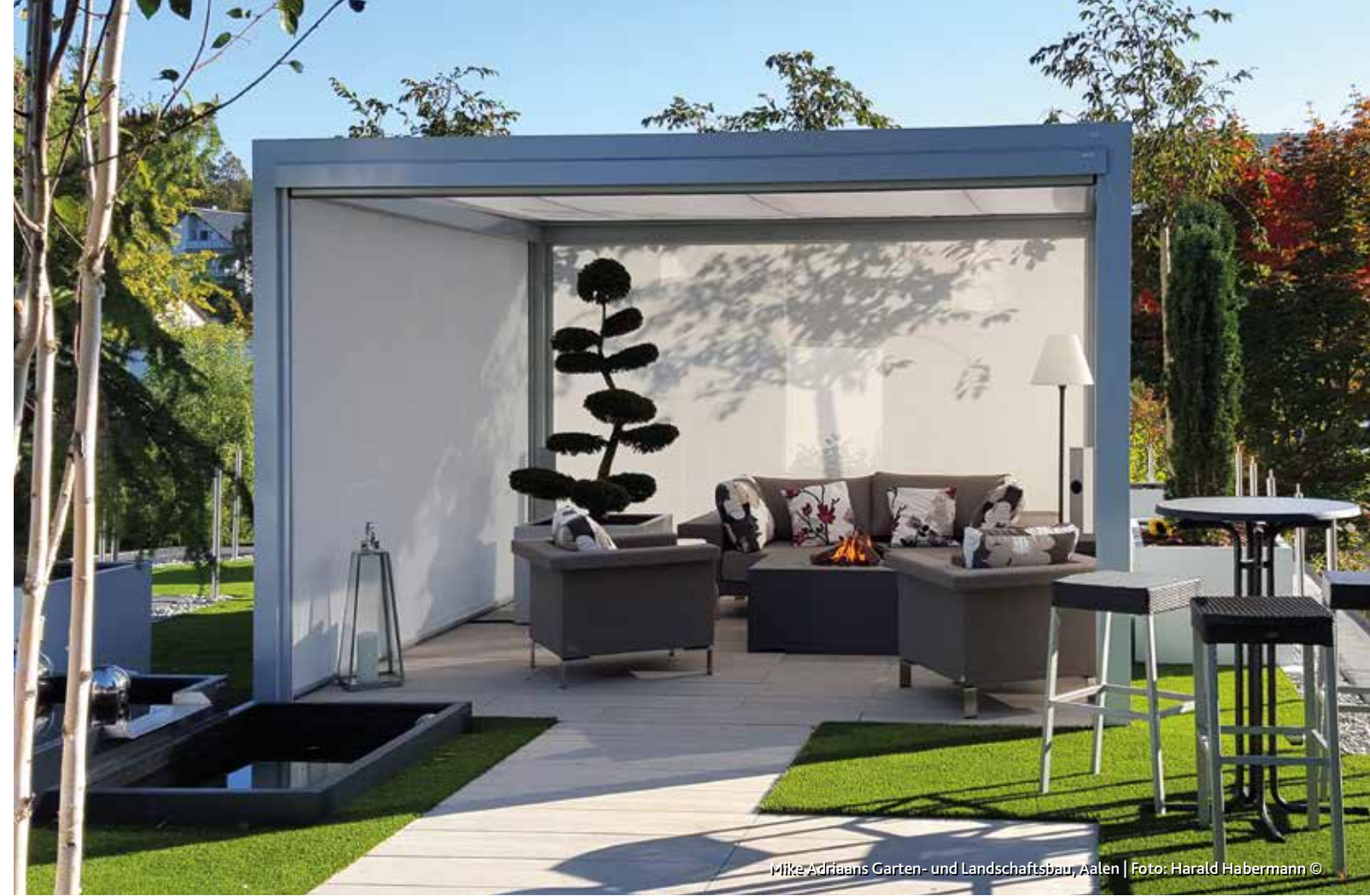
Mike Adriaens Garten- und Landschaftsbau, Aalen | Foto: Harald Habermann ©

Während im Dachbereich üblicherweise Acryltücher aus einer entsprechenden umfangreichen Stoffkollektion verwendet werden, bietet sich für die Seitenmarkisen der Einsatz von Twilight Pearl-Gewebe an, da dieses aufgrund der leichten Transparenz auch im ausgefahrenen Zustand noch eine gewisse Durchsicht ermöglicht und damit den Charakter des „textilen Wintergartens“ ideal untermauert.