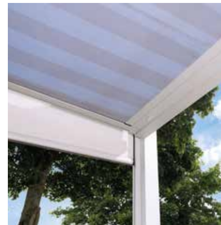
In die Seiten- und Frontbereiche lassen sich zusätzliche Senkrechtanlagen integrieren