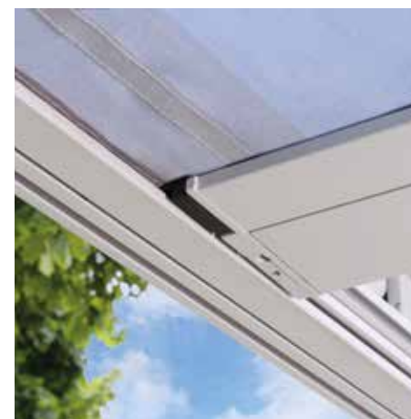
Die ZIP-Technik sorgt für ein Höchstmaß an Stabilität und Langlebigkeit